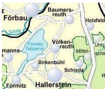
Förmitzspeicher Fläche: 110 ha